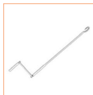
■ asta di manovra con gancio snodata