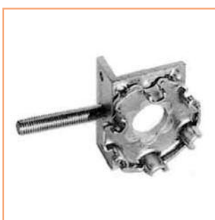
■ SUPPORTO OPERATORE regolabile, avvitabile con coppia piattine di tenuta