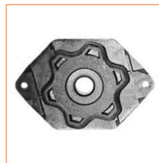
■ SUPPORTO LT/CSI