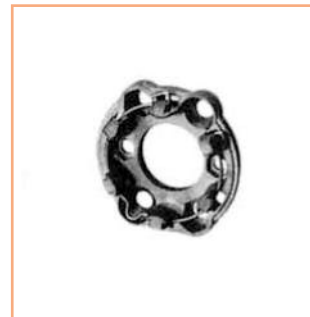
■ SUPPORTO OPERATORE in zama, interasse 48 - 60 mm Coppia max : 80 Nm